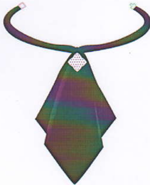
Նկ2. Փողկապ կանացի