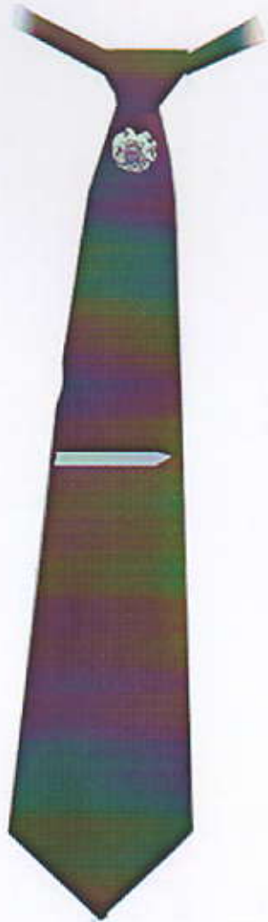
Նկ1. Փողկապ տղամարդու